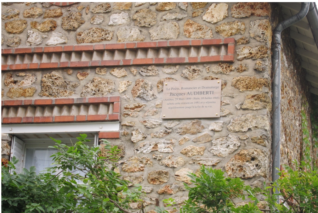
Pose de la plaque du souvenir sur la maison familiale de Lozère (Coresse) en 2015