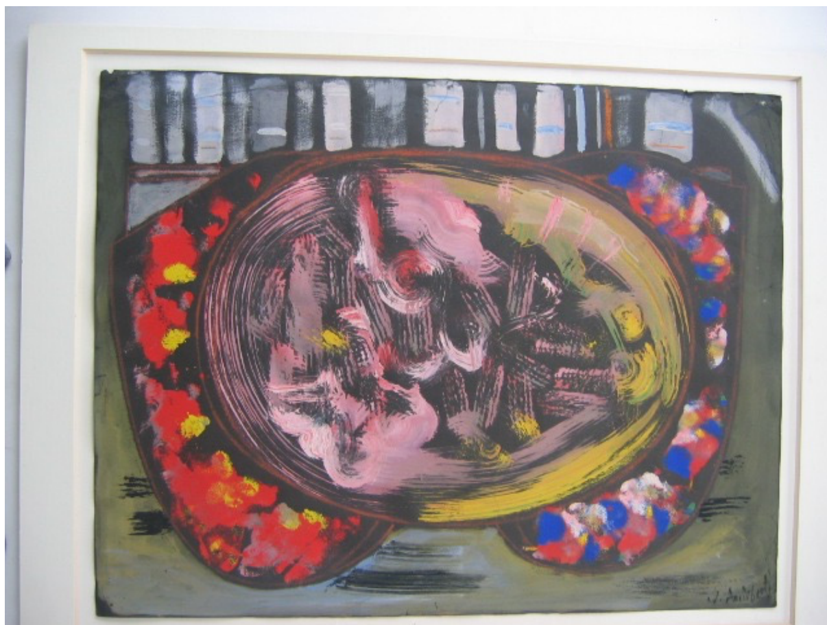
Pastel signé, non daté de Jacques Audiberti

Le Prix a été donné en novembre 2017 à Sylvain Tesson. Bien que jeune encore, cet écrivain à l'imaginaire voyageur a déjà à son actif une œuvre importante. Son dernier livre, Un été avec Homère , aux Editions des Equateurs, livre écrit sur une Ile grecque, nous a semblé répondre à l'exigence littéraire du Prix, tout en nous plongeant dans une Méditerranée très audibertienne.